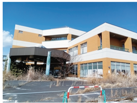
震災の爪痕がまだ残っていました

屋上からは中間貯蔵施設や福島第一原発の煙突を望むことができませんでした。一方で、施設全体からは復興を前面に打ち出す意図が強く感じられ、事故に対する国や東京電力の教訓が十分に伝わってこないという印象も残りました。