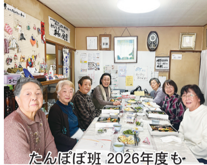
たんぽぽ班 2026年度も元気にスタート!

みんなでも話し合い新年度も多彩な献立で絆を深めます。 総会を終え、にぎやかに昼食タイム。 (事務局まとめ)