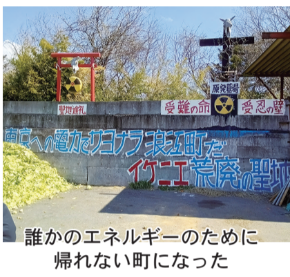
誰かのエネルギーのために 帰れない町になった

双葉駅周辺では復興が進み、震災の痕跡を感じることは少なくなっており、かつての双葉厚生病院や隣接する介護施設跡地が、当時を伝える数少ない建造物となっていました。