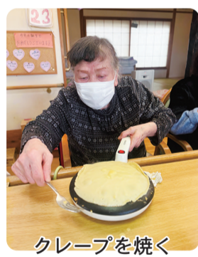
クレープを焼く利用者さん

2月は新しい利用者さんも10人近く増え、毎年恒例のレクリエーション、豆まき鬼退治ゲームで今年も盛り上がりました。バレンタインデーにはクレープを焼き、デコレーションして食べました！