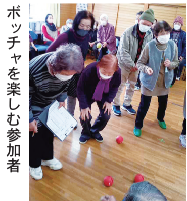
ポッチャを楽しむ参加者