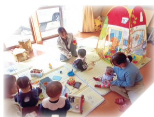
3世代やパパさんの参加がありました

◆毎月第3火曜日 10:00～11:30 ◆新栄集会所 (ヨークベニマル船岡店となり)