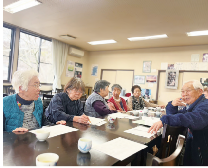
仲間ふやしも計画に!!