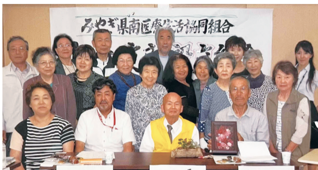
山元支部結成総会 (2016年当時)

ござしております。今でも朝な夕なに海に向かって静かに合掌…。ありがとうございます。