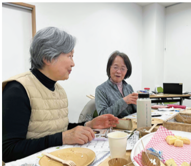
食べ比べでチーズの個性を楽しみました

またいろいろな種類のチーズ食べ比べもあり、チーズの知識も深まる美味しくて楽しい班会となりました。 ※参加費500円。 (事務局まとめ)