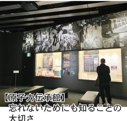
【原子力伝承館】 忘れないためにも知ることの大切さ