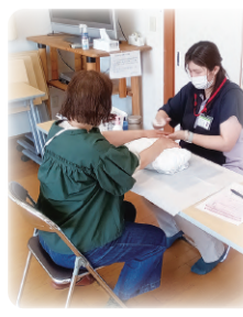
ハンドマッサージを行いました 好評でした

3月17日、初参加の方を含め、3組9人の参加がありました。にぎやかな時間を過ごしました。