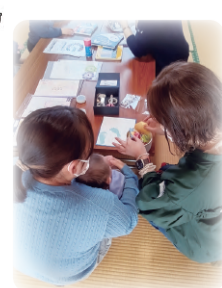
足型きれいに取れました