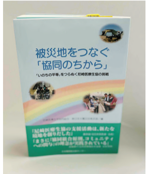
被災地をつなぐ「協同のちから」～「いのちの平等」をつらぬいた尼崎医療生協の挑戦～ 日本機関紙出版センター発行

して助かり、いまは長町病院で看護師として働きながら語り部活動にも取り組んでおられる方の存在を知り、震災から15年を経てなお山元町とのつながりに深いご縁を感じています。 震災復興の課題はなお多いことと存じます。 これからも連帯し、安心して暮らし続けられるまちづくりにも取り組んでいきたいと思います。