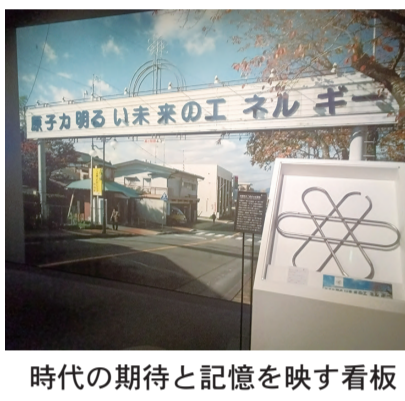
時代の期待と記憶を映す看板

屋上からは中間貯蔵施設や福島第一原発の煙突を望むことができませんでした。一方で、施設全体からは復興を前面に打ち出す意図が強く感じられ、事故に対する国や東京電力の教訓が十分に伝わってこないという印象も残りました。