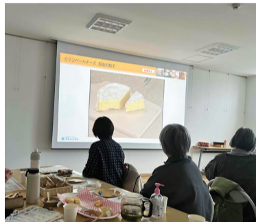
意外に奥深いチーズの豆知識